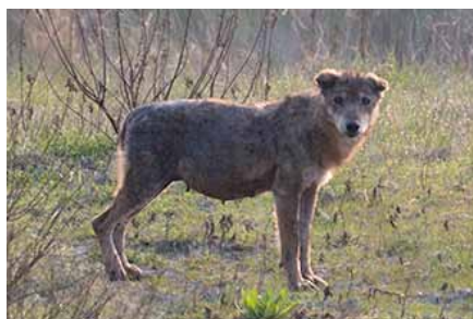
▲ Ibrido Cane-Lupo.

› è assente nel cane la consapevolezza di quelli che possono essere i punti vitali della preda, quelli da attaccare per determinarne la morte e, conseguentemente,