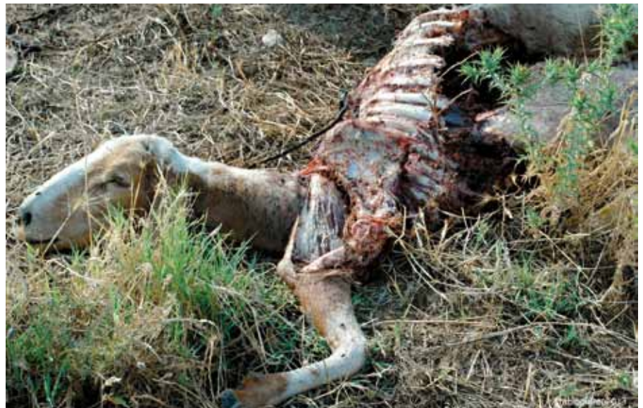
▲ Carcassa di pecora.

Estratto dal Report 2013-2014 "Il Lupo nel Materano" Rizzardini G., Quinto F. scaricabile al link: http://www.retecollogicabasilicata.it/ambiente/files/docs/DOCUMENT_FILE_110048.pdf .