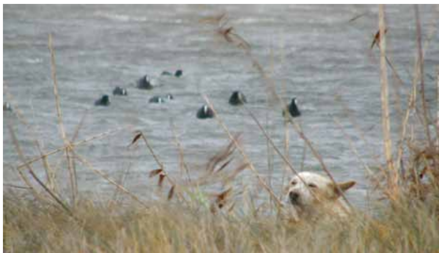
◀ Cane randagio che, frequentemente imbrancato con altri cani, aveva imparato a tendere agguati ad Anatre e ad altri Uccelli acquatici che nuotavano nello stagno presso il quale il branco frequentemente stazionava. Nella foto appare aver allentato l'attenzione per le Folaghe, ben visibili nelle vicinanze, per prestare attenzione a me che mi ero avvicinato a pochi metri di stanza per scattargli alcune foto.

che è stato spesso messo in second'ordine e che solo da poco assiste ad un processo di rivalutazione.