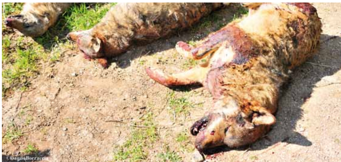
◀ Lupi morti nel territorio di Pomarico.

Il secondo ritrovamento si tratta di una femmina uccisa da colpi di fucile a canna liscia il 25 dicembre del 2012 in contrada Montecamplo nelle vicinanze della Gravina di Laterza. È stato prelevato un campione di tessuto per le succes-