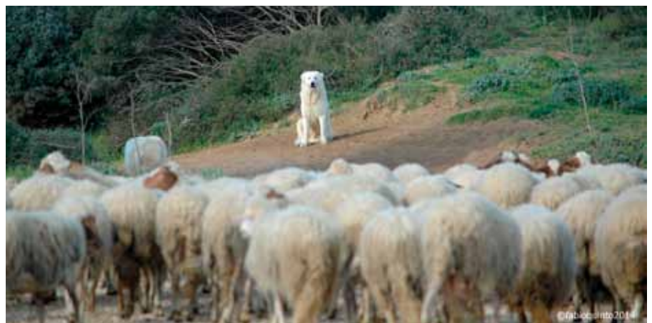
▲ Pastore Maremmano a guardia di un gregge di pecore.