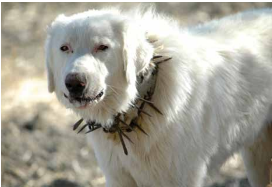
◀ Il Pastore Maremmano-abruzzese, probabilmente la più efficace forma di difesa dagli attacchi dei Lupi alle greggi ed alle mandrie, con il collare anti lupo.

predatore. Vengono da sé altri approcci che vanno dalla automatica valorizzazione della zona stessa, alla necessità di garantire una opportuna tutela all'animale, all'opportunità di considerare mezzi e strategie che tengano conto degli inevitabili impatti di questa nuova presenza con alcune delle attività produttive.