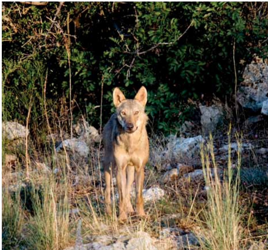
◀ Lupo italico ( Canis lupus italicus ).

Dottore Forestale, Commissario Capo Corpo Forestale dello Stato