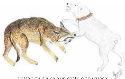
Lotta tra un lupo e un pastore abruzzese munito di chioppa (disegno Gerardi D.).

Nei combattimenti tra i lupi esiste un segnale nei giochi infantili che blocca l'aggressività del più forte. Questo segnale consiste nel porgere la gola